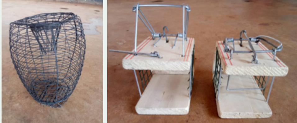
Aina za mitego ya panya ambayo hupatikana kwa urahisi